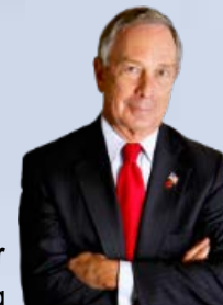
TCFD Chair Michael Bloomberg

TCFD hat Empfehlungen herausgegeben, die Unternehmen bei der Identifizierung, Bewertung und Berichterstattung klimabezogener Risiken und Chancen unterstützen sollen